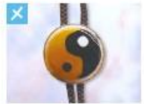
ループタイ (丸) .....2,000円