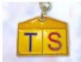
アルファベットキーホルダー .....2,000円