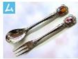
スプーン・フォーク .....2,000円