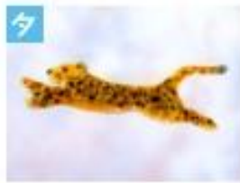
ピューマのブローチ .....1,500円