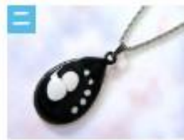
しずくのペンダント .....1,500円