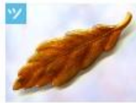
木の葉のブローチ .....1,500円