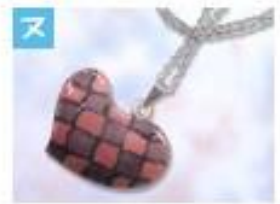
ハートのペンダント .....1,500円