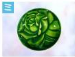
バラのブローチ .....2,000円