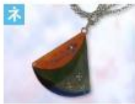
イチヨウのペンダント .....1,500円