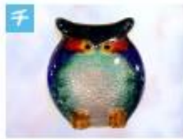
みみずくのブローチ .....1,500円