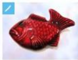
鋼の筆置き・箸置き .....1,500円