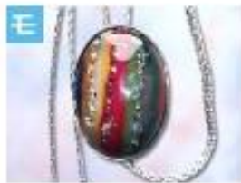
ループタイ (楕円) .....2,000円