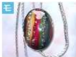
ループタイ (楕円) .....2,000円