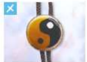
ループタイ (丸) .....2,000円