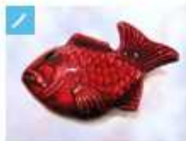
網の筆置き・箸置き .....1,500円