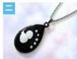
しずくのペンダント .....1,500円