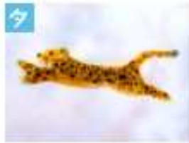
ピューマのブローチ .....1,500円