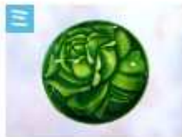
バラのブローチ .....2,000円