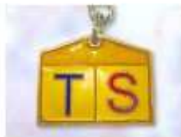
アルファベットキーホルダー .....2,000円