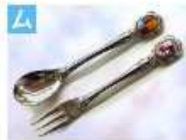
スプーン・フォーク .....2,000円