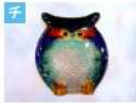
みみずくのブローチ .....1,500円