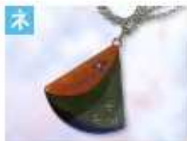
イチョウのペンダント .....1,500円