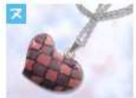
ハートのペンダント .....1,500円