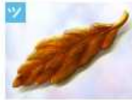
木の葉のブローチ .....1,500円