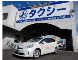
※車両はイメージです